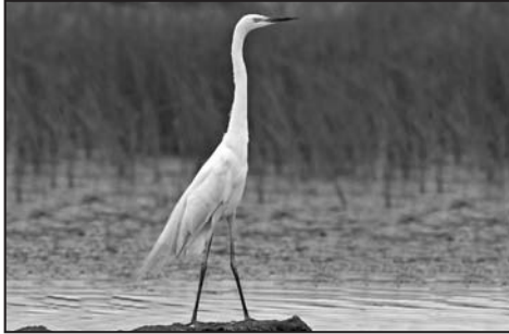
Bild: Silberreiher